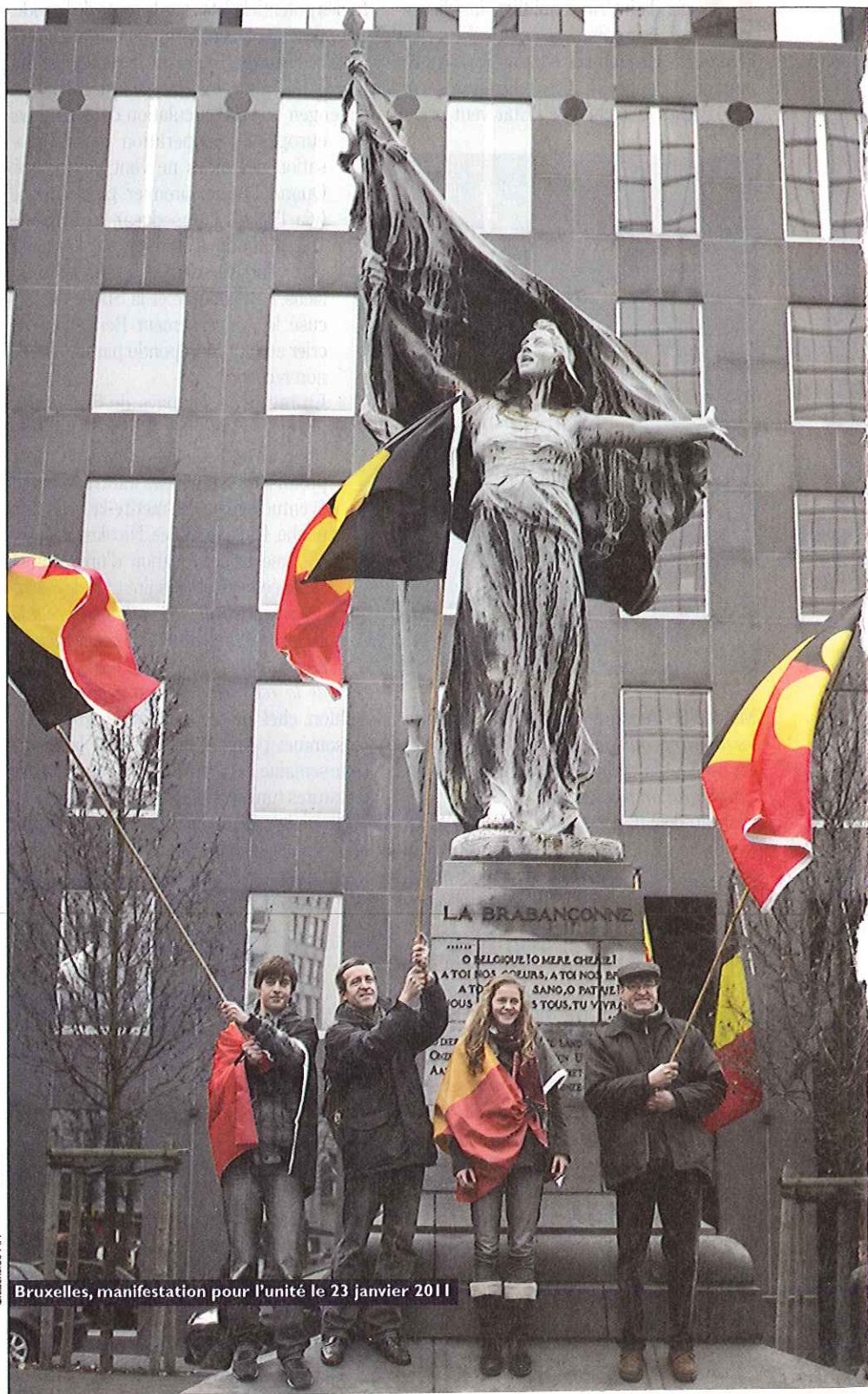
Bruxelles, manifestation pour l'unité le 23 janvier 2011

Pendant ce temps, le pays vaque à ses occupations et n'accorde plus au feuilleton de la crise politique qu'une attention distraite et railleuse. Disons qu'il oscille entre fatalisme, inquiétude et franche rigolade. Malgré l'appel de Benoît Poelvoorde à la grève du rasoir, on ne constate pas de recrudescence du port de la barbe. Ni, pour autant que l'on puisse le savoir, de baisse notable de l'activité sexuelle, en dépit du mot d'ordre « no government, no sex » lancé par une sénatrice socialiste flamande, gynécologue de son état. Les Belges sont d'un naturel blagueur. Tandis que le site lerecorddumonde.be