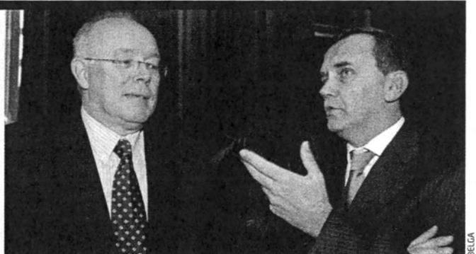
Benoît Cerexhe, à droite, ministre CDH de l'Economie et de l'Emploi (ici, avec Charles Picqué) : « Si tu ne vas pas à Actiris, Actiris viendra à toi. »

poussiéré et humanisé l'organisme régional d'activation des chômeurs. L'Orbem, rebaptisé Actiris il y a deux ans, a simplifié ses structures, proposé ses offres sur son site www.actiris.be et ouvert des antennes dans plusieurs communes. « Si tu ne vas pas à Actiris, Actiris viendra à toi ! » prévenait Cerexhe, paraphrasant Féval. Néanmoins, le suivi des demandeurs d'emploi manque encore d'efficacité. Annoncé depuis plus d'un an, le système d'envoi d'offres d'emploi ciblées par SMS, qui a démontré son succès en Flandre, peine à être activé. Les chèques-langues seraient utilisés par 5 à 10 % seulement des demandeurs d'emploi, alors que 90 % des chômeurs sont unilingues. Les chèques-formation ne rencontreraient guère plus de succès, alors que le manque de qualification est considéré comme l'une des causes principales du taux