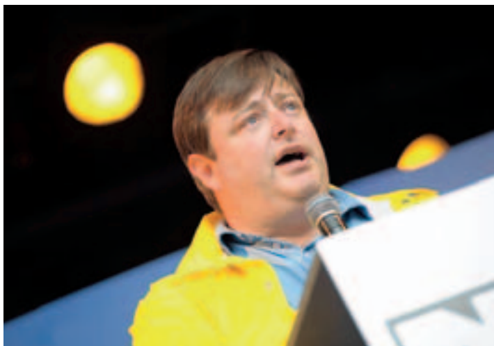
LA N-VA de De Wever est la seule formation dont le nombre de membres ne cesse de croître ces dernières années.

Une étude réalisée par le centre d'étude de la vie politique (Cevipol) de l'ULB présente l'évolution des formations politiques en Belgique, appelées à se transformer pour satisfaire aux nouvelles exigences des citoyens. Elle met en exergue les difficultés qu'elles éprouvent à s'adapter à la nouvelle donne fédérale et explique au passage les blocages persistants du système belge.